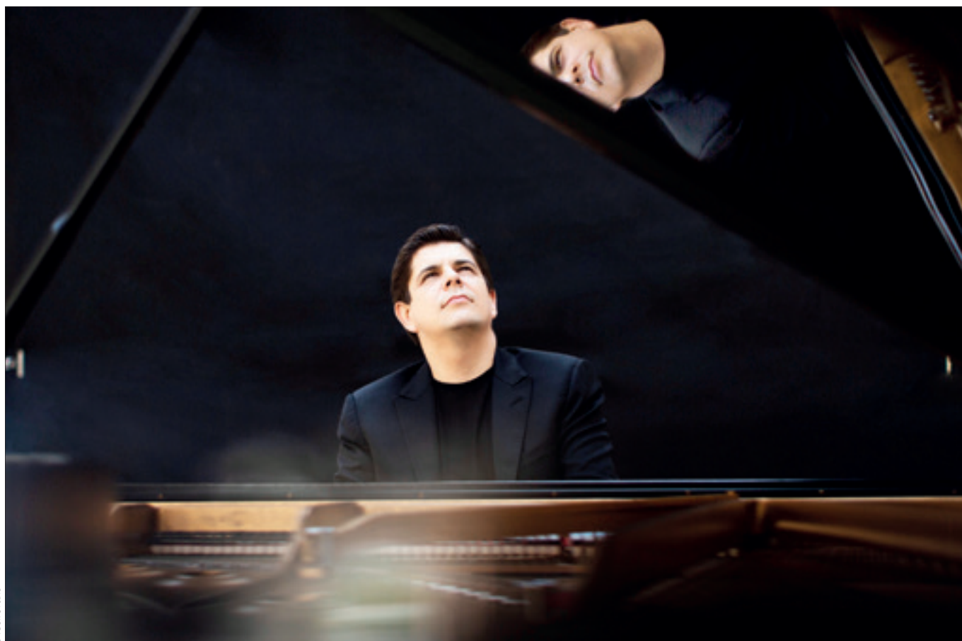
El pianista Javier Perianes, Primer Premio del Concurso Internacional de Piano de Jaén en 2001, interpretará los Cinco Conciertos para piano de Beethoven, dentro del III Festival de Piano, organizado por la Diputación de Jaén.